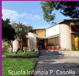
Scuola Infanzia P. Casolla