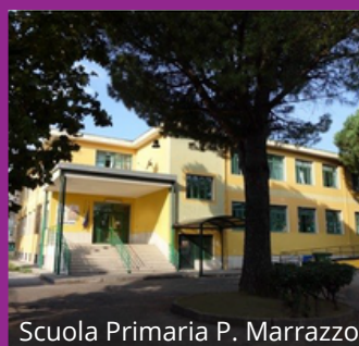
Scuola Primaria P. Marrazzo