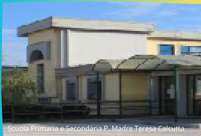
Scuola Primaria e Secondaria P. Madre Teresa Calcutta