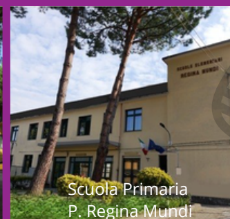
Scuola Primaria P. Regina Mundi