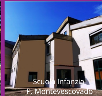
Scuola Infanzia P. Montevescovado