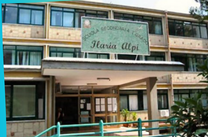
Scuola Secondaria Ilaria Alpi